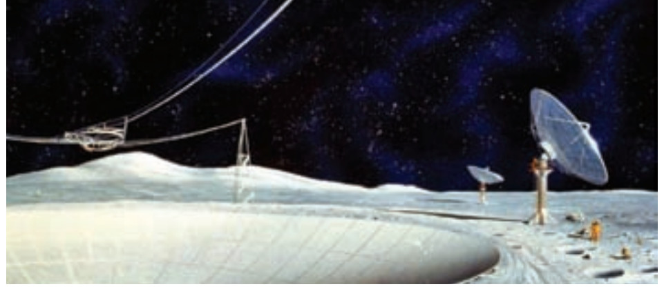
Resim 2. Gün geçtikçe hayatımızın daha da vezgeçilmez bir parçası olan cep telefonlarımızdan, uydudan yayın yapan televizyon kanallarına kadar birçok farklı teknoloji ürünü, yararlarının yanı sıra, radyo bölgede araştırma yapmak isteyen bilim dünyasına çeşitli sorunlar da oluşturmaktadır. Bu nedenle, özellikle Dünya'dan gelecek radyo gürültüden uzak bir Ay krateri üzerine bir radyo çanak yerleştirmeyi planlayan bilim insanlarının düşüncelerini bu gibi görüntüler süslemekte.

üretkenliği artırmak üzere teknolojilerin, sistemlerin, uçuş işlemlerinin ve araştırma tekniklerinin Ay üzerinde denenmesi