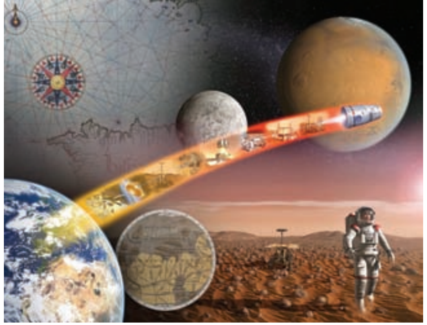
Resim 5. İnsanlığın Ay'da yapacağı çalışmalar sadece kendimize yeni bir dünya yaratmak için değil, aynı zamanda Ay'dan başka yaşanabilecek yeni gök cisimleri bulmak için de yararlı olacak. Mars çalışmalarına öncülük edeceği ve bilim dünyasının acemiliğini giderebileceği bir deneme ortamı olarak düşünüldüğünde Ay'ın değeri biraz daha artıyor...

Tüm bunların yanı sıra Ay madenlerinin kullanımı ve düşük çekim ve yüksek vakum ortamında yapılabilecek araştırmalar gibi yaratıcı ve ticari projeler, insanoğluna çeşitli olanaklar sunabilir. Ay madenlerinin asıl kullanım alanı ticari uydu operatörlerine satılması olabilir. Böylelikle Dünya yö-